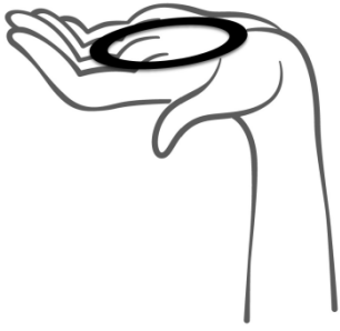
Abbildung 1 Nehmen Sie GinoRing aus dem Beutel