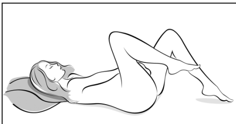
Abbildung 3 Nehmen Sie für die Einlage von GinoRing eine bequeme Haltung ein