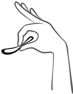
Abbildung 2 Drücken Sie GinoRing zusammen